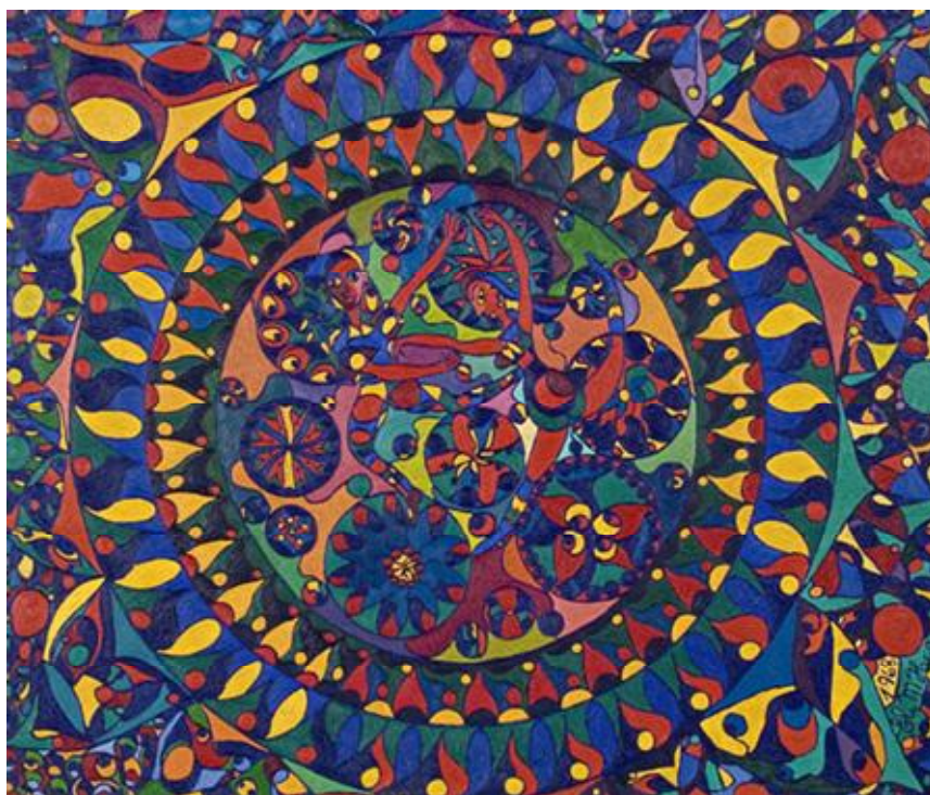
Brincando de rodas e rodinhas - técnica mista, 80x96cm, 1968