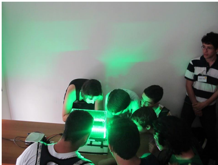
FIGURA 5: PROFESSORA E ALUNOS VISUALIZANDO O RASTRO DEIXADO PELOS RAIOS CÔSMICOS