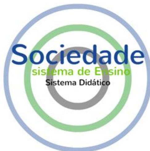
FIGURA 1: RELAÇÃO ENTRE A SOCIEDADE, SISTEMA DE ENSINO E SISTEMA DIDÁTICO

O autor propõe que o Saber Sábio e o Saber Ensinado dialogam dentro de um contexto denominado Sistema Didático. Este se encontra dentro do Sistema de Ensino e estes, por fim, se encontram imersos em um amplo e complexo sistema chamado de Sociedade, conforme ilustramos na figura 1.