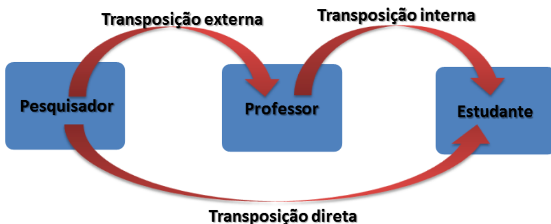
FIGURA 8: PROCESSOS DE TRANSPOSIÇÃO DIDÁTICA

Nossa contribuição está na proposta de levarmos esses tópicos da Física Moderna e Contemporânea até os estudantes via conexão entre escola, universidade e laboratório. Acreditamos que essas três unidades podem dialogar em conjunto e desta forma contribuir para um processo que garanta ao máximo a legitimidade do Saber de referência. Para que isso aconteça, acreditamos que ninguém melhor do que o pesquisador (conhecedor da linguagem própria da área) para tornar, através da mudança da linguagem característica do Saber Sábio, o Saber mais compreensível ao público alvo. Para que isso aconteça, acreditamos que é necessário que os três atores interajam e dialoguem: pesquisador, professor e estudante. Nesse sentido, percebemos que o MasterClass oferece este espaço interativo e dialógico e que, além disso, possibilita três processos diferentes de Transposição Didática, conforme mostra a figura 8.