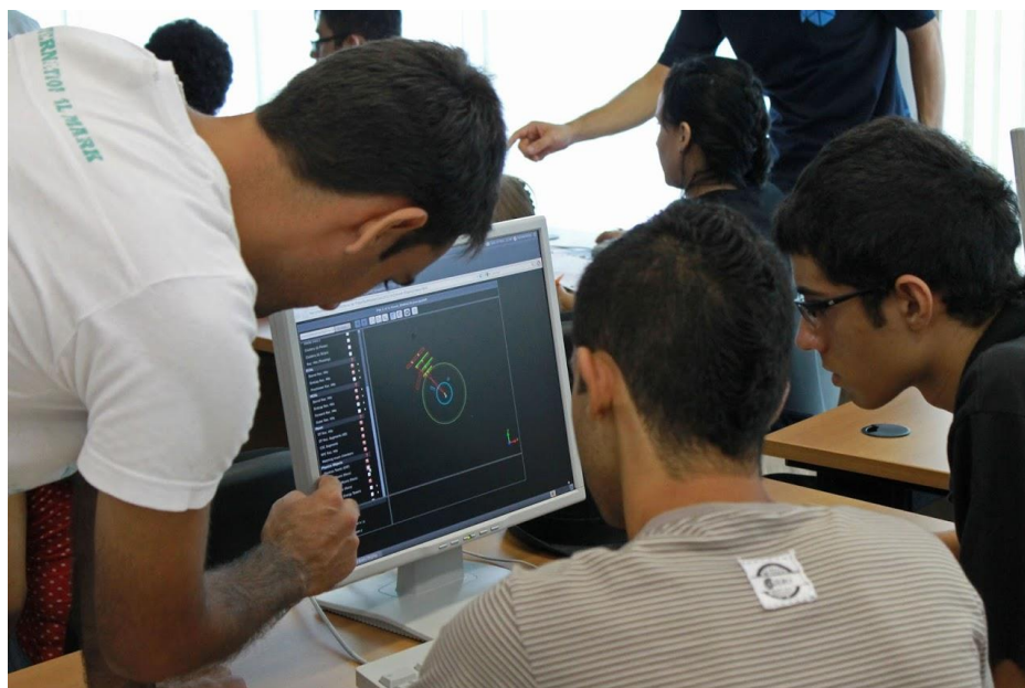
FIGURA 5: PROFESSOR AUXILIANDO SEUS ALUNOS NA REALIZAÇÃO DO EXERCÍCIO