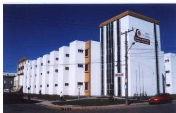
Área Acadêmica e Hospital Universitário/ Campus Saúde