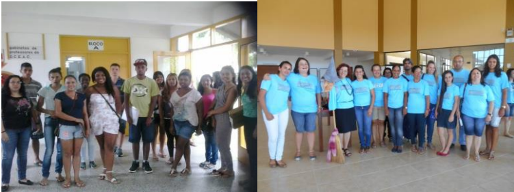
Acolhida dos estudantes indígenas e quilombolas e Acolhida PIBID- FURG