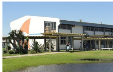
Prédio da SEAD e Prédio de Aulas 6/ Campus Carreiros