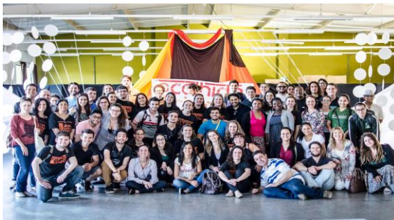
Seminário de Encerramento da Acolhida Cidadã 2015

“FURG: acolhendo pessoas, abraçando culturas e construindo conhecimento”