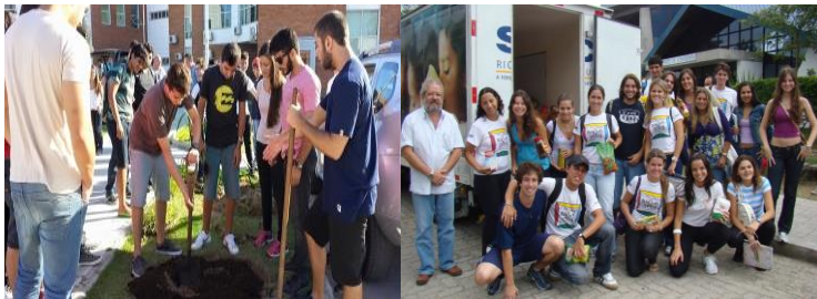
Acolhida socioambiental C3 e arrecadação de alimentos PET- EA