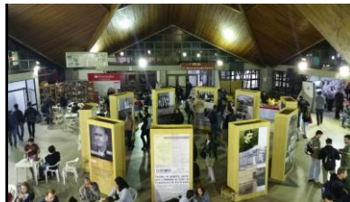
Prédio do Centro Convivência no Campus Carreiros