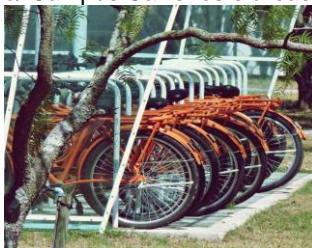
Bicicletário Campus Carreiros