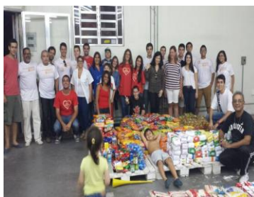
Atividades: Passeio pelo Rio Grande e Sábado Solidário

Pensando em sua cidadania e no respeito que você merece por ter conquistado seu lugar na Universidade, a FURG criou o Programa de Acolhida Cidadã/Solidária, com finalidade de recepcionar com alegria e integrar de forma carinhosa os novos estudantes à vida universitária. Abaixo, apresentamos a deliberação nº 164/2010 do CONSELHO DE ENSINO, PESQUISA, EXTENSÃO E ADMINISTRAÇÃO: