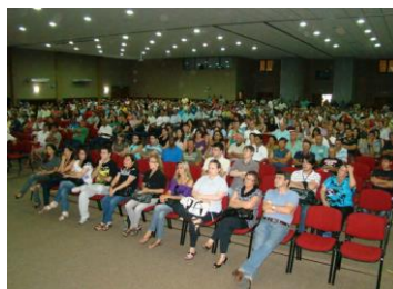
Prédio do CIDECSUL