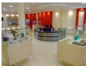
Núcleo de Memória Engenheiro Francisco Martins Bastos/NUME

O complexo de museus da FURG complementa a missão da Universidade no que se refere às atividades de ensino, pesquisa e extensão. Como centros de cultura, irradiação e preservação de conhecimentos, esses espaços estão abertos à visitação pública e impulsionam o desenvolvimento turístico da cidade. É formado pelo Núcleo de Memória Engenheiro Francisco Martins Bastos/NUME; Museu Oceanográfico Professor Eliézer de Carvalho Rios; Centro de Convívio Meninos do Mar/CCMAR; Museu Antártico; Eco-Museu da Ilha da Pólvora; Museu Náutico e Museu da Comunicação Rodolfo Martensen. Para saber mais, acesse: www.museu.furg.br e visite nossos museus.