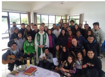
Interior do Espaço Ecumênico/ Campus Carreiros