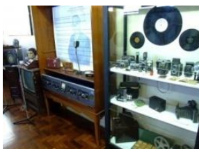
Museu da Comunicação Rodolfo Martensen