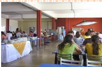
Restaurantes Universitários Campus Carreiros e CCMar