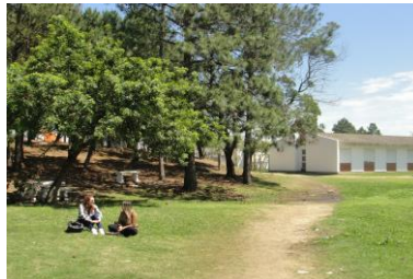
Redário/ Campus Carreiros e áreas verdes