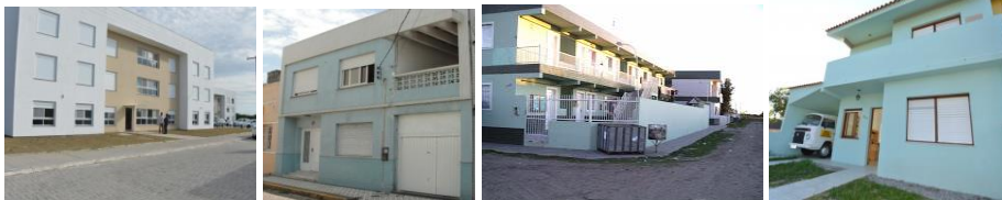
Casa do Estudante Interna, Saúde, Externa e SLS.

situação de vulnerabilidade socioeconômica. As casas oferecem dormitórios, cozinhas, banheiros e espaço de estudo. Em 2015, 363 estudantes foram atendidos.